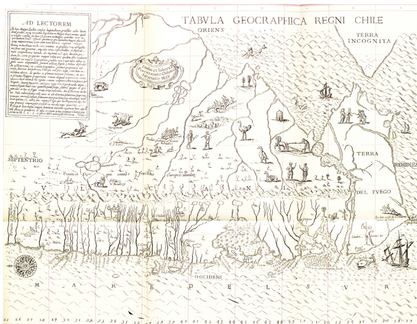
FIGURA 2. Tabula geographica regni Chile (Rome, 1646), Alonso de Ovalle (cf. Furlong 1936: lámina n.º 4).

Tal como ha documentado la estudiosa María José Brañes (2006), esta enciclopédica composición nacida de la evangelización de frontera en la región de la Araucanía es un registro y sistematización del saber gramatical y lexicográfico, cultural, cartográfico, así como musical sobre el trabajo pastoral ignaciano en el sur del Reino de Chile (66). La séptima parte del Chilidúgu de Havestadt, el “diario de viaje”, 11 da cuenta de la travesía misionera del jesuita por tierras indígenas de la Araucanía durante los últimos meses de 1751 y los primeros de 1752, en el contexto de las llamadas “misiones circulares”. 12 Bajo el título de Carta geográfica y Diario [1] 13 se conjugan dos tipologías textuales en que la experiencia del viaje misional