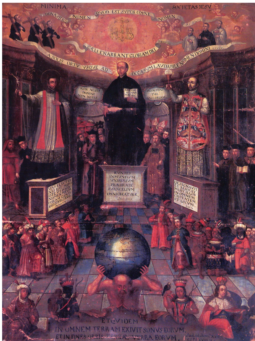
FIGURA 1. Alegoría del triunfo de los jesuitas en las cuatro partes del mundo. Iglesia de San Pedro (Anónimo, Lima).

bresale además la presencia de las figuras preponderantes de la Compañía, instalados sobre pedestales, su fundador san Ignacio de Loyola, y los misioneros jesuitas Francisco Javier y san Francisco de Borja, forjadores de las