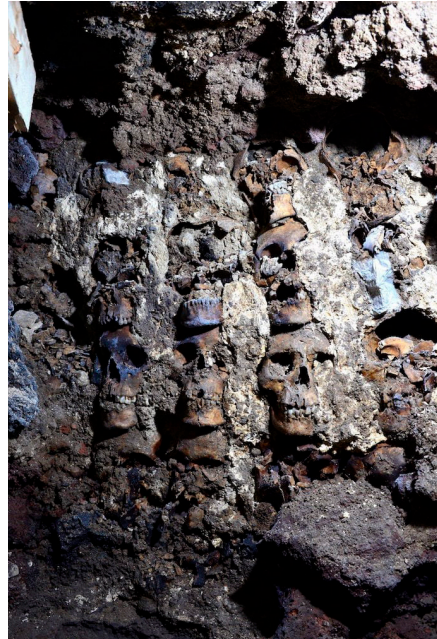
Ilustración 3.  6 .