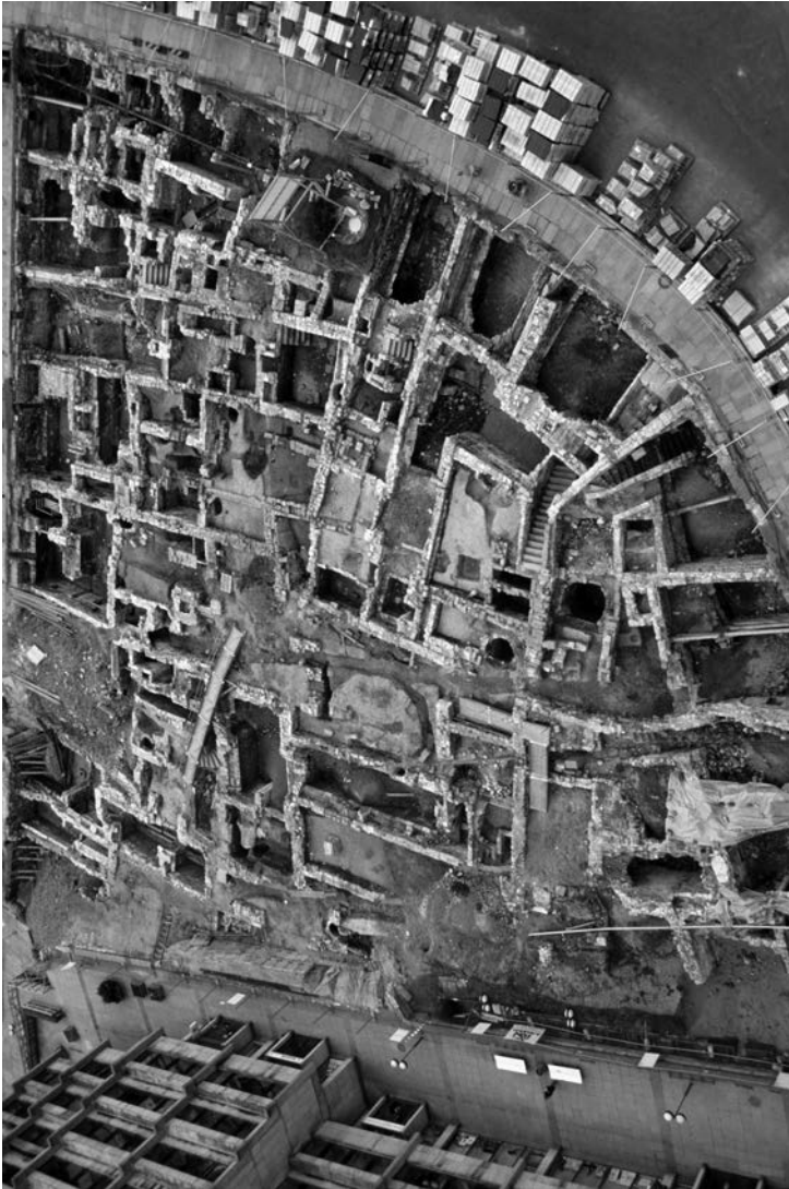
1999 wurde als erstes von bislang sechs weiteren das Quartier III am Dresdner Neumarkt untersucht. Im Vordergrund befinden sich die hervorragend erhaltenen Keller »An der Frauenkirche« – Leichenfunde wurden hier nicht getätigt.