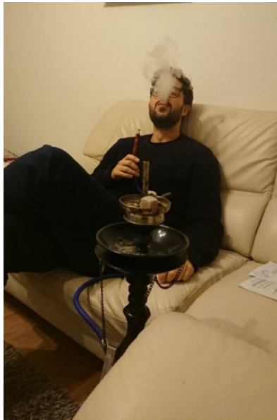
Abb. 1: Ich beim Shisha-Rauchen während der Feldforschung

te »beobachtende Teilnahme«, womit sie eine alltagspraktische Bearbeitung des eigenen Forschungsthemas meinen, die nur dann gelänge, »wenn man bei dem, was die Leute tun, für die man sich interessiert, mitmacht« (Hitzler & Eiseiwicht 2020: 43). Die beobachtende Teilnahme war zu gleichen Teilen Ermöglichung wie Einlösung meines Vorhabens, gelebte Beziehungen zu erforschen. Sie war für eine Forschung über Beziehungen wesentlich besser geeignet als Formen teilnehmender Beobachtung, bei denen das Pendel in die andere Richtung einer stärker distanzierten Beobachtung und eines reduzierten Teilnahmemodus ausschlug. Ich hatte das Gefühl, über die beobachtende Teilnahme in methodologischer Hinsicht den Beziehungen am nächsten zu kommen. Sie ging mit einer umfassenden Teilnahme an den Praktiken des Feldes einher. Dazu gehörte zum Beispiel, dass ich, obschon Nichtraucher und Asthmatiker, regelmäßig den Shisha-Rauch mit meinen eigenen Lungen aufsog (siehe Abbildung 1).