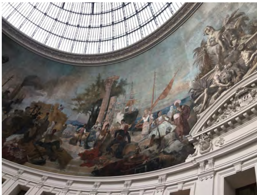
Fig. 1 : L'Europe dans la peinture de plafond de la Bourse de Commerce, Paris, 2021.

zon. Une réflexion de Peter Sloterdijk dans son essai Si l'Europe s'éveille illustre parfaitement ce contexte :