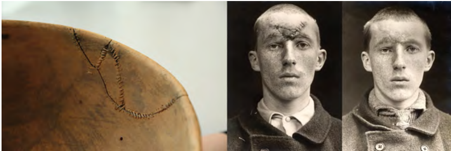
Fig. 3: Kader Attia, Open Your Eyes, 2010. Double slide projection. 80 slides each (detail). Courtesy of the artist. Collection MoMA New York, Collection Frac Pays de la Loire, Collection Moderna Museet Stockholm, private collection, and Galleria Continua.