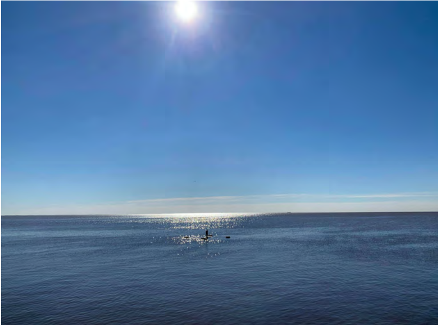
Fig. 3: Claudia Fontes, Reconstrucción del retrato de Pablo Míguez , 2000/2010. Mirror of polished stainless steel. 1,70 x 0,45 x 0,40 m. Río de la Plata, 70m off the coast, Parque de la Memoria, Avenida Costanera Norte, Rafael Obligado 6745, Buenos Aires. Photo: Claudia Fontes, courtesy of the artist. http://claudiafontes.com/project/reconstruction-of-the-portrait-of-pablo-miguez/ .

background, while the sculpture takes up a concrete example of disappearance . After experiencing the monument, being confronted with the depiction of a single human figure standing alone on the water evokes surprise: At first glance, the sculpture might be frightening, as I have argued above regarding the notion of a spectral discourse; it is the past that does not cease to remain subtly present in the present. The fragile impression of the sculpture is reinforced by the contrast to the massiveness of the monument and by the vast surroundings of the river (Fig.3).