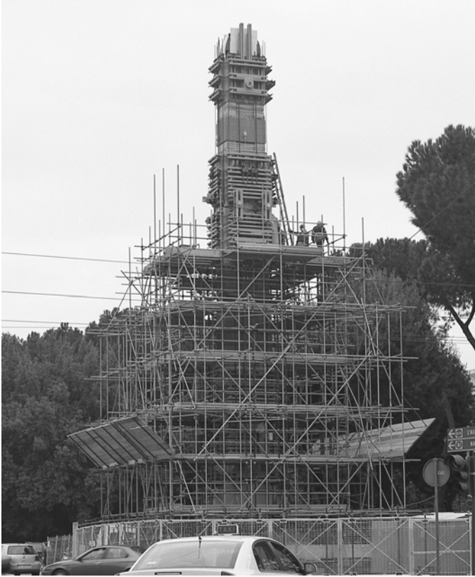
Fig. 2 : La stèle d’Axoum en démontage à la Porta Capena, 2003.

tradition de peinture éthiopienne 16 . Quand la stèle est rétablie à Axoum par une cérémonie gouvernementale en 2008 (fig. 3), elle devient, après des décennies de guerres et déstabilisations intérieures, « un instrument de renouveau national, d’unité et de sens civique » (Bekerie 2005, 87). Ceci évoque la question de l’identité politique et culturelle de la société éthiopienne, mais aussi la problématique des fonctionnalisations de la mémoire pour la construction des versions spécifiques de cette identité (Santi 2014, 220–222). Ceci va de même, bien sûr, pour la société italienne qui se voit confrontée au vide de l’emplacement où se trouvait ladite stèle. La discussion publique tourna surtout autour de la question de savoir s’il fallait placer à la Porta Capena un autre obélisque ou s’il y en avait déjà assez à Rome (Bianchi