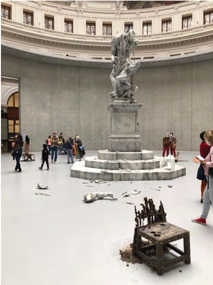
Fig. 2 : Urs Fischer dans la collection de François Pinault de la Bourse de Commerce.

statue est dotée, comme une bougie, d'une mèche enflammée. Ainsi, dans un processus continu de fusion, la Sabine kidnappée se débattant dans les bras d'un Romain est-elle détruite sous les yeux des visiteurs. Cette statue est entourée de reproductions, également en cire, de sièges d'horizons culturels les plus divers qui soient – jusqu'à une chaise en plastique de notre époque –, qui fondent elles aussi lentement sous nos yeux. Sous le grand panorama peint, synthèse de la domination de l'Europe face à l'horizon du monde, la statue, entourée de sièges d'époques et de cultures diverses, peut ainsi devenir l'allégorie de l'Europe déchue de sa position illusoire de centre du monde, en quête de formes d'apparence nouvelles dans la dissolution.