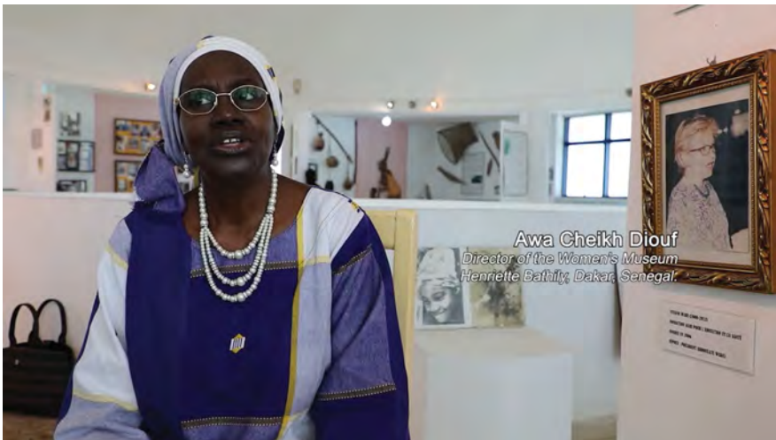
Fig. 5: Awa Cheikh Diouf. Kader Attia, Les Entrelacs de l'Objet | The Object's Interlacing (2020, 00:25:32).