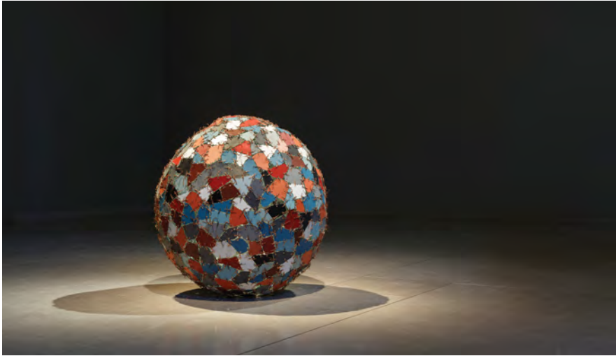
Fig. 1: Kader Attia, Chaos + Repair = Universe , 2014. Sculpture. Mirror fragments, metal wires. Exhibition view “Sacrifice and Harmony,” MMK Museum für Moderne Kunst, Frankfurt/Main, 2016. Courtesy of the artist and Galleria Continua. Photo: Axel Schneider.

for its clashes over Israel's role in the middle east, but it also saw the firm advocacy of a number of African countries and African-American NGOs for reparations. While these claims did not amount to much action at the time, they successfully reintroduced the topic to the global agenda, setting the ground for the founding of the Mouvement International pour les Réparations in Martinique in 2001 or the 2003 demands of reparation voiced by the Haitian president Jean-Bertrand Aristide, to name but two examples.