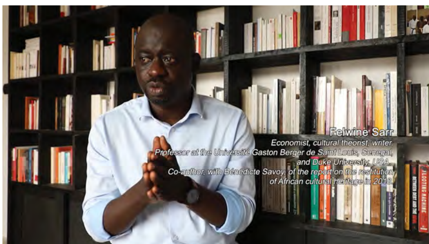
Fig. 9: Felwine Sarr. Kader Attia, Les Entrelacs de l'Objet | The Object's Interlacing (2020, 00:11:19).