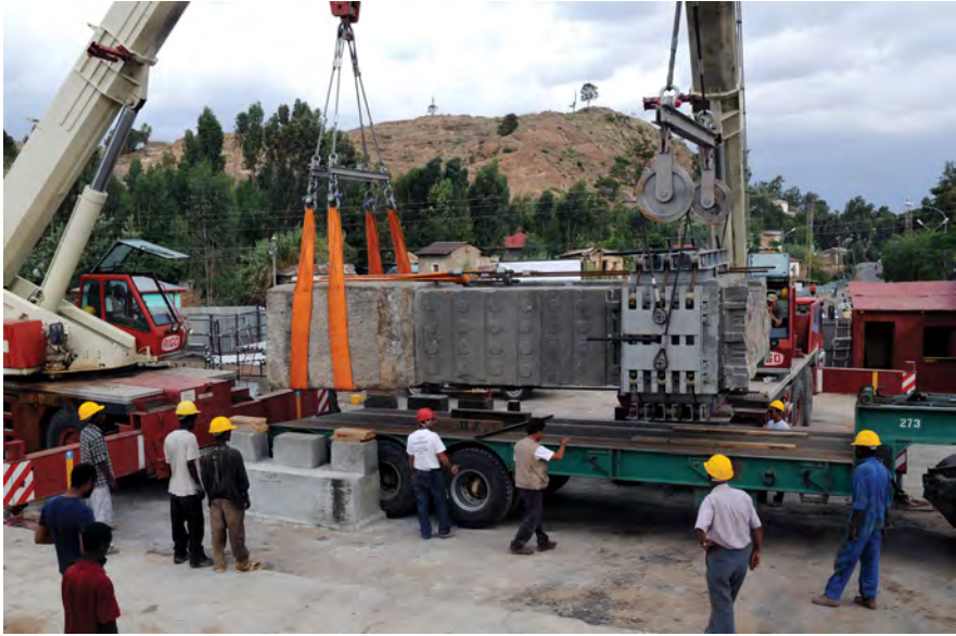
Fig. 1 : Ré-installation de l'obélisque à Axoum, 2008.

Surtout, l'histoire n'a jamais été décolonisée en Italie. Le colonialisme a été englouti dans cet oubli, et les points de référence symboliques du fascisme ont été abandonnés à la dégradation comme s'ils étaient des radeaux fantomatiques dans un fleuve du non-dit (Bianchi et Scego 2020 [2014], 87) 14 .