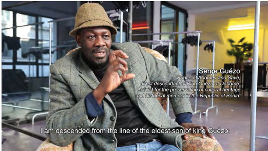
Fig. 7: Serge Guézo. Kader Attia, Les Entrelacs de l'Objet | The Object's Interlacing (2020, 00:02:48).