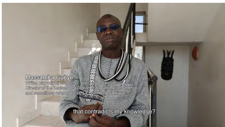
Fig. 4: Massamba Guèye. Kader Attia, Les Entrelacs de l'Objet | The Object's Interlacing (2020, 00:16:18).