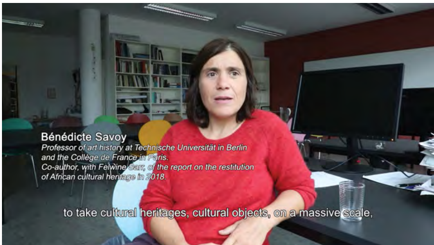
Fig. 6: Bénédicte Savoy. Kader Attia, Les Entrelacs de l'Objet | The Object's Interlacing (2020, 00:13:26).