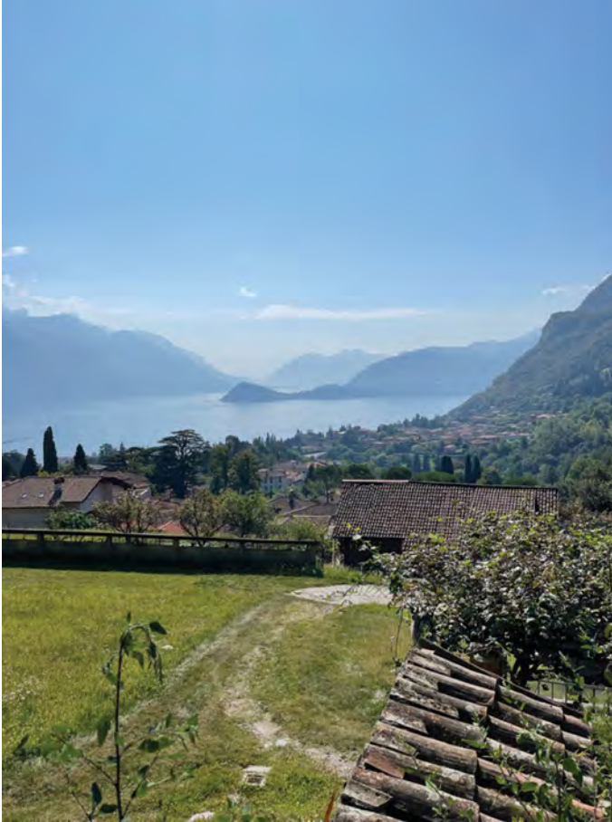
Fig. 1: Villa Vigoni, German-Italian Centre for European Dialogue.

possible reparations for intergenerational and international injury. In other words, the place in which we spoke was itself a symbolic site of thinking about repair, reparation, and redress in a multi-national European context.