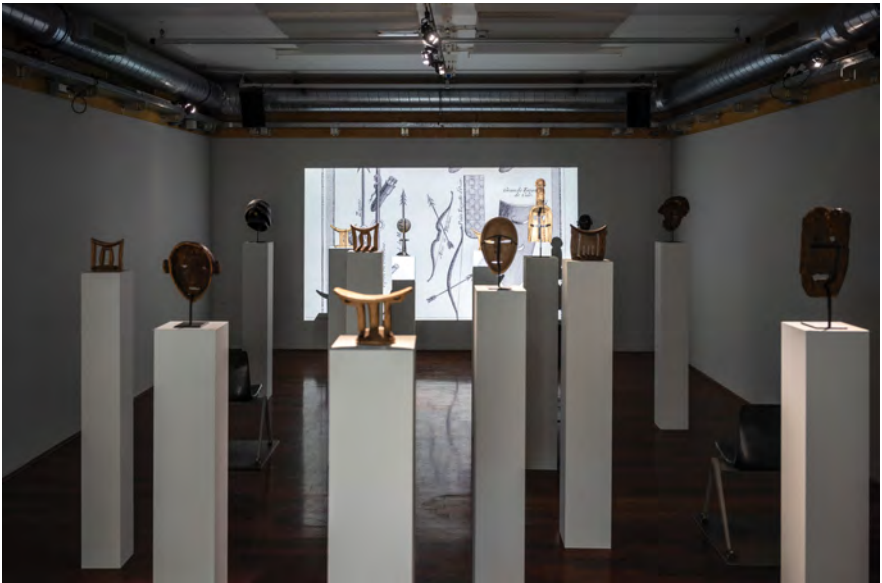
Fig. 1: Kader Attia, Les Entrelacs de l'Objet ( The Object's Interlacing ), 2020. Installation contenant un vidéo (78 min.) et 17 objets (copies d'artefacts africains en bois ou en nylon, imprimées en 3D), faisant partie de l'exposition Fragments of Repair/Kader Attia , BAK, basis voor actuele kunst, Utrecht, 2021.