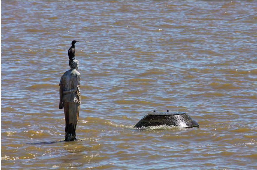
Fig. 1: Claudia Fontes, Reconstrucción del retrato de Pablo Míguez , 2000/2010. Mirror of polished stainless steel. 1,70 x 0,45 x 0,40 m. Río de la Plata, 70m off the coast, Parque de la Memoria, Avenida Costanera Norte, Rafael Obligado 6745, Buenos Aires. Photo: Guadalupe Miles, courtesy of the artist. http://claudiafontes.com/project/reconstruction-of-the-portrait-of-pablo-miguez/ .

installed in 2010. 15 The work is built in the water of the Río de la Plata with a distance of about 70m to the coast. The sculpture measures 1.70 x 0.50 x 0.70 meters and is life-sized. It is the stature of a boy turning his back towards the viewer. The standing figure is attached to a floating steel platform, of which only four