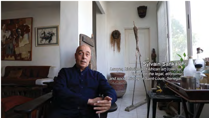
Fig. 2: Sylvain Sankale. Kader Attia, Les Entrelacs de l'Objet | The Object's Interlacing (2020, 00:02:28).