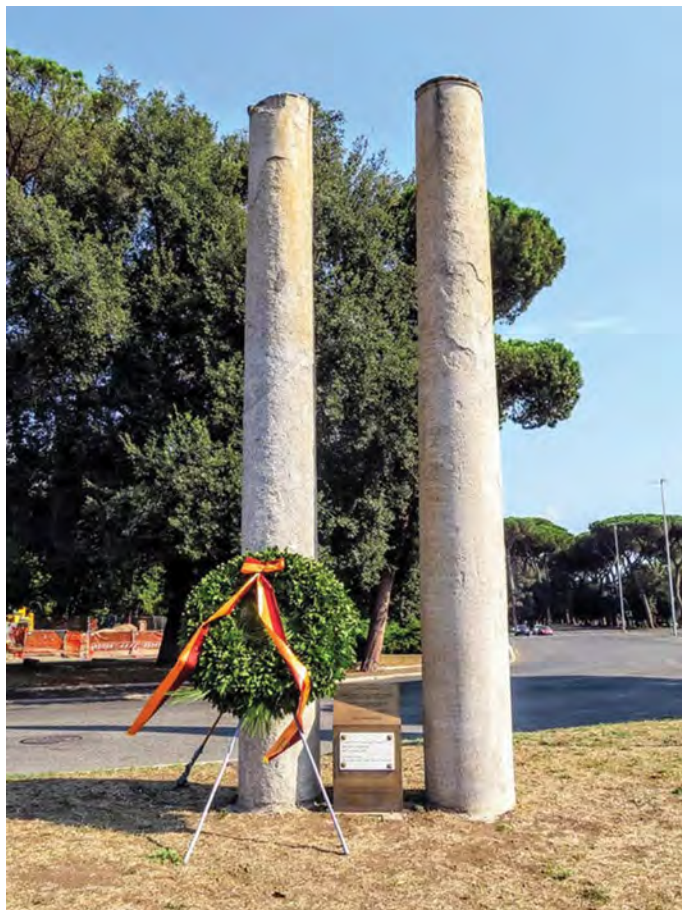
Fig. 4 : Twin Towers Memorial, Piazzale di Porta Capena, 2020.

écrit en 2014 : « Personne ne percevait ce vide sur la place comme un vide de mémoire » (Bianchi et Scego 2020 [2014], 97–98) 17 .