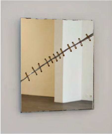
Fig. 2: Kader Attia, Repaired Broken Mirror , 2013. Sculpture. Mirror, metal wire. Exhibition view “Repairing the Invisible,” SMAK, Ghent, 2017. Courtesy of the artist and Galerie Nagel Draxler. Photo: Dirk Pauwels.

Justice, in the words of the American philosopher Nancy Fraser (2004, 380), requires not only recognition, but also redistribution and representation; symbolic reparation is not the equivalent of immaterial . On the other hand, material reparations without a symbolic side to them can easily turn into an attempt at ridding oneself of a moral responsibility, too. This is what Achille Mbembe has in mind when he argues that restitutions of African looted art are insufficient without an apology or some other form of symbolic reparation. “So that the restitution of African objects is not the occasion for Europe to buy itself a good conscience at a cheap price, the debate must be recentred around the historical, philosophical, anthropological and political stakes of the act of restitution,” Mbembe writes (2019, 70), clearly positing the claim for restitutions within the framework of both material and symbolic reparation.