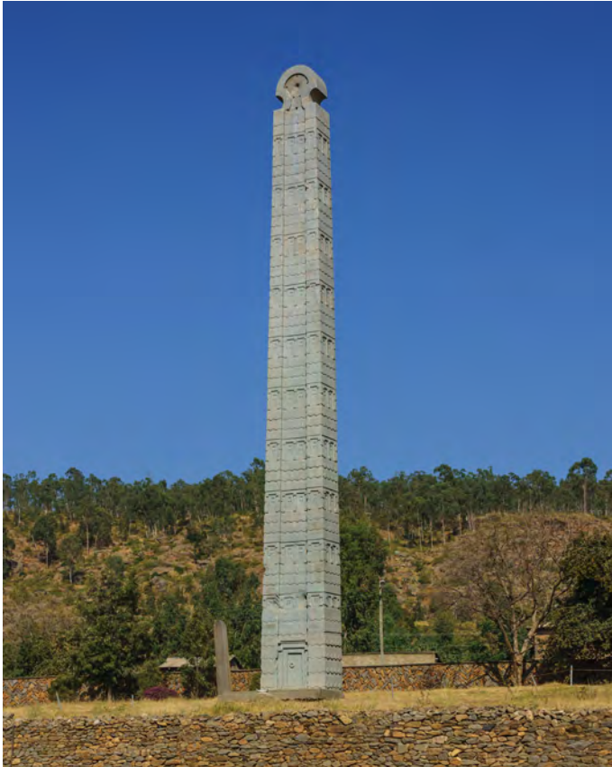
Fig. 3 : La statue après sa restitution au Tigré, 2008.

et Scego 2020 [2014], 95–98). On y instaure finalement un mémorial consistant en deux colonnes antiques symbolisant les deux tours du World Trade Center de New York pour commémorer le 11 septembre 2001 (fig. 4).