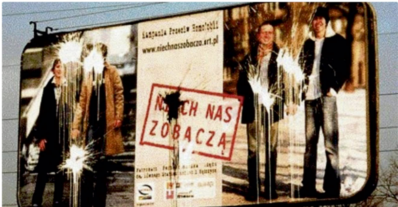
Abbildung 2: Eine Plakatwand der Kampagne »Sollen sie uns doch sehen«, die mit Farbbomben beworfen wurde.