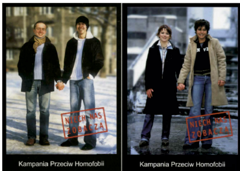
Abbildung 1: Zwei Fotos aus der Serie »Sollen sie uns doch sehen«.