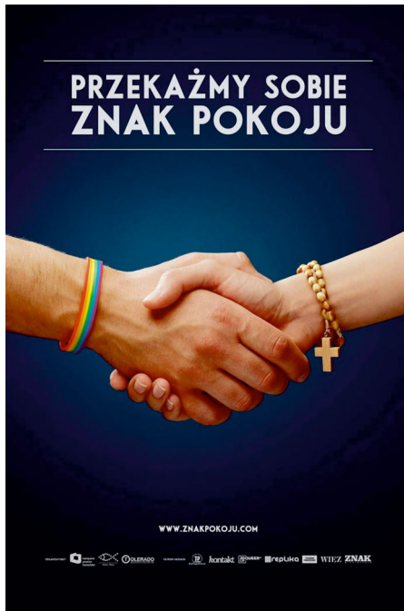
Abbildung 3: Poster der Kampagne »Lasst uns den Friedensgruß austauschen« von 2016.