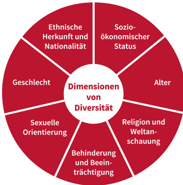
Abb.1: Dimensionen von Diversität (aus: Kirchenamt der EKD: Inklusion gestalten [s. Anm. 17], S. 17.)

Auch wenn angesichts des registrierbaren Attraktivitätsverlustes des Inklusions-Paradigmas in den politischen wie akademischen Öffentlichkeiten offen bleiben muss, ob der Inklusionsbegriff zukünftig praktisch-theologisch überhaupt