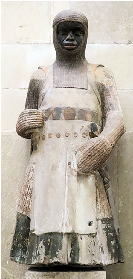
Abb. 1: St. Maurice statue at the Dome of Magdeburg, ca. 1245 3

Protestants are said to be critical if not sceptical towards the veneration of saints as they fear that veneration comes close to idolatry. Protestants are especially hesitant towards the Roman Catholic protocol and regulations of beatification, canonization and glorification procedures. The declaration of a deceased person as an officially recognized saint requires proof of their virtuous life, giving witness to the faith the person lived by, and at least one, better two miracles following intercessory prayer by the venerated. It is hard to imagine that any openly gay, lesbian, polyamorous, trans or otherwise queer person would be able to pass the