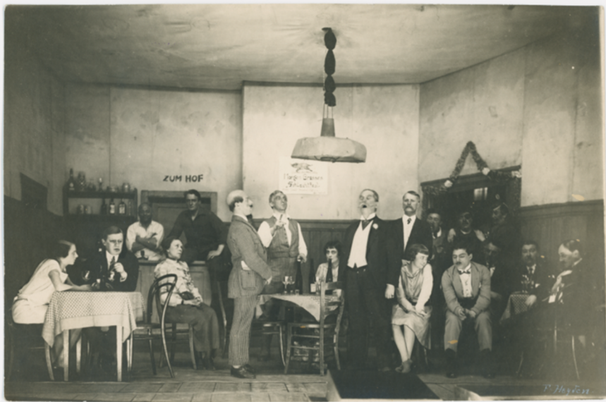
Abb. 1: Szenenfoto von Der fröhliche Weinberg , Münchner Kammerspiele 1926.

zur Aufführung von Der fröhliche Weinberg in den Münchner Kammerspielen 1926 eher nicht fort. Das Foto zeigt einen Raum mit Tischen und mehreren gut gekleideten Figuren, die trinken und sich unterhalten. Im Hintergrund ist ein Tresen erkennbar, hinter dem eine Figur im weißen Hemd mit verschränkten Armen auf die Personen vor sich blickt und die einen Wirt in einem Gastraum darstellen könnte. Die Gestaltung der Szene deutet darauf hin, dass es sich dabei um eine Szene des zweiten Aktes im Wirtshaus des Wirts Eismayer handelt.