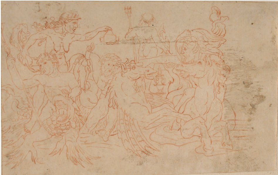
Abbildung 12: Andrea Mantegna – Kopie: Kampf der Tritonen (Kat. 123)

Die Naturstudie wurde mit schwarzem Stift skizzenhaft rasch gestaltet und dann in einem zweiten Schritt die Kontur akzentvoll mit der Feder in Schwarz nachgezogen. Abgebildet scheint ein afrikanischer Büffel (Syncerus) zu sein. Für die Rekonstruktion des Entstehungskontextes fehlen leider weitere Anhaltspunkte, daher erscheint insbesondere die zeitliche Einordnung nicht ganz unproblematisch. Der deutlich verschmutzte Zeichnungsträger wurde allseitig stark beschnitten.