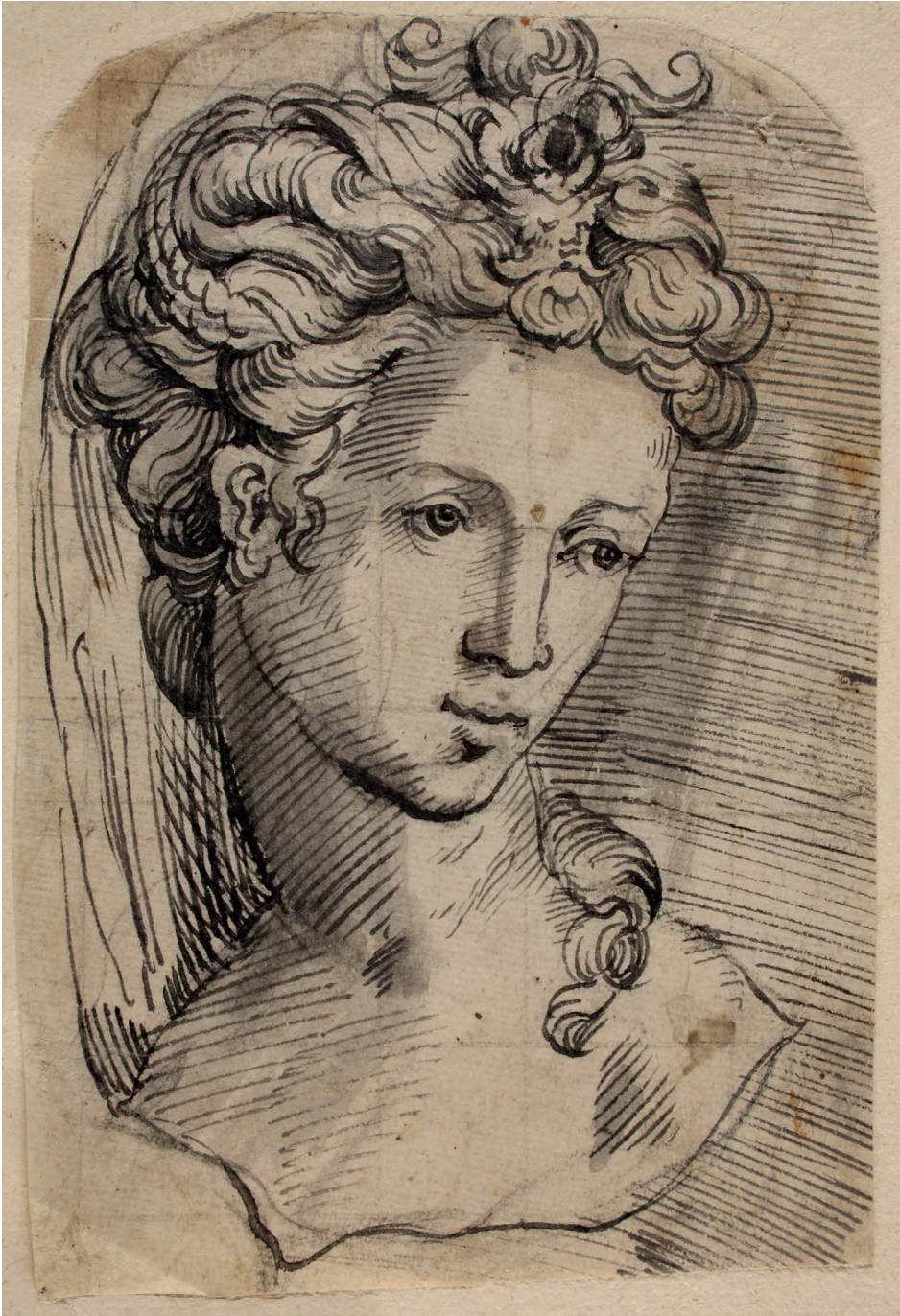
Abbildung 7. Franken?: Weibliche Büste mit phantastischem Kopfschmuck (Kat. 14)