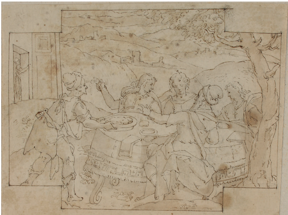
Abbildung 20. Jean II. Cousin – Umkreis ? : Gastmahl im Freien (Kat. 169)

Die vorsichtige Zuordnung der feinen Federzeichnung zum Umkreis Jean II. Cousins geht auf Monroe Warshaw zurück 24 . Vor allem das charakteristische auf dünne Umrisslinien fokussierte Strichbild scheint diese Einordnung zu bestätigen. Die Einfassungen lassen auf den Entwurf zu einem größeren Werk, vielleicht ein Wandgemälde, schließen. Das Verso zeigt einige locker gezeichnete Federproben.