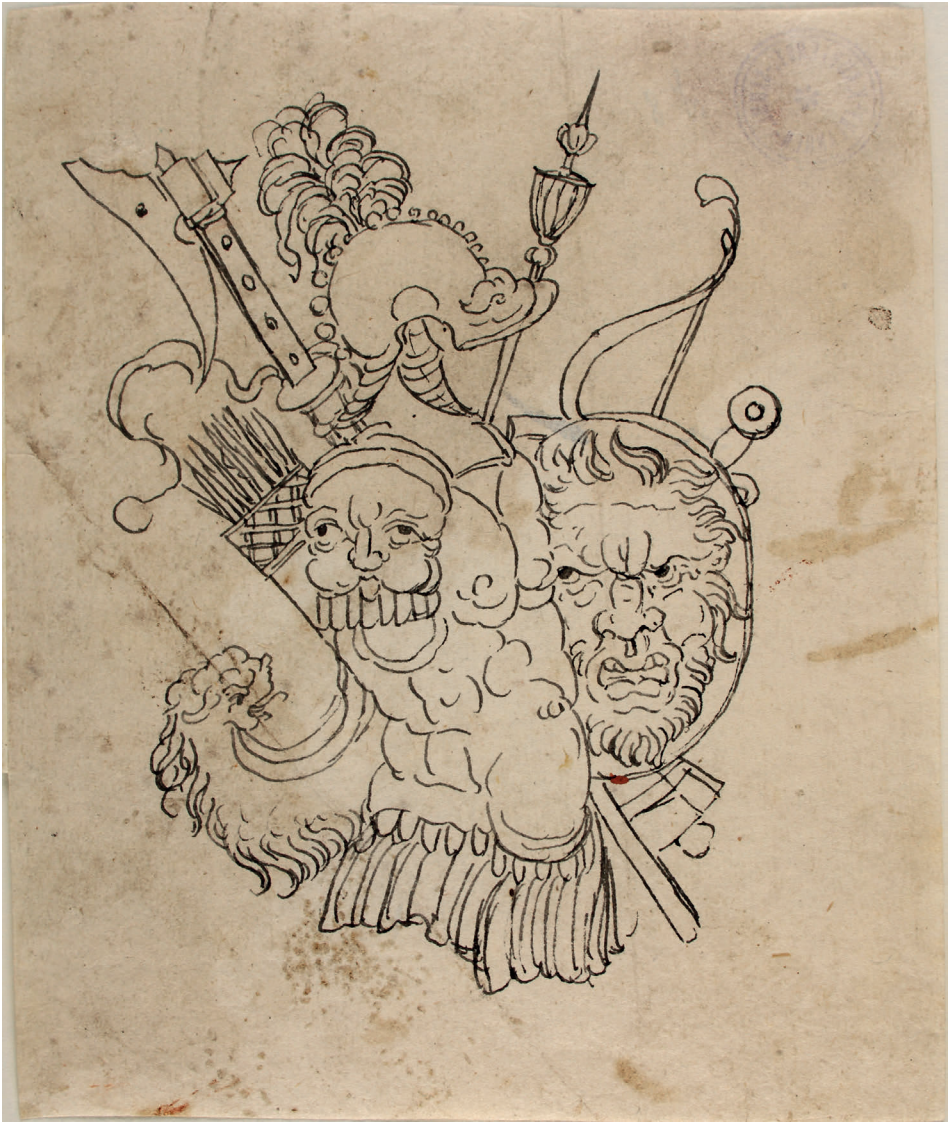
Abbildung 9: Nürnberg (?): Trophäe (Kat. 23)