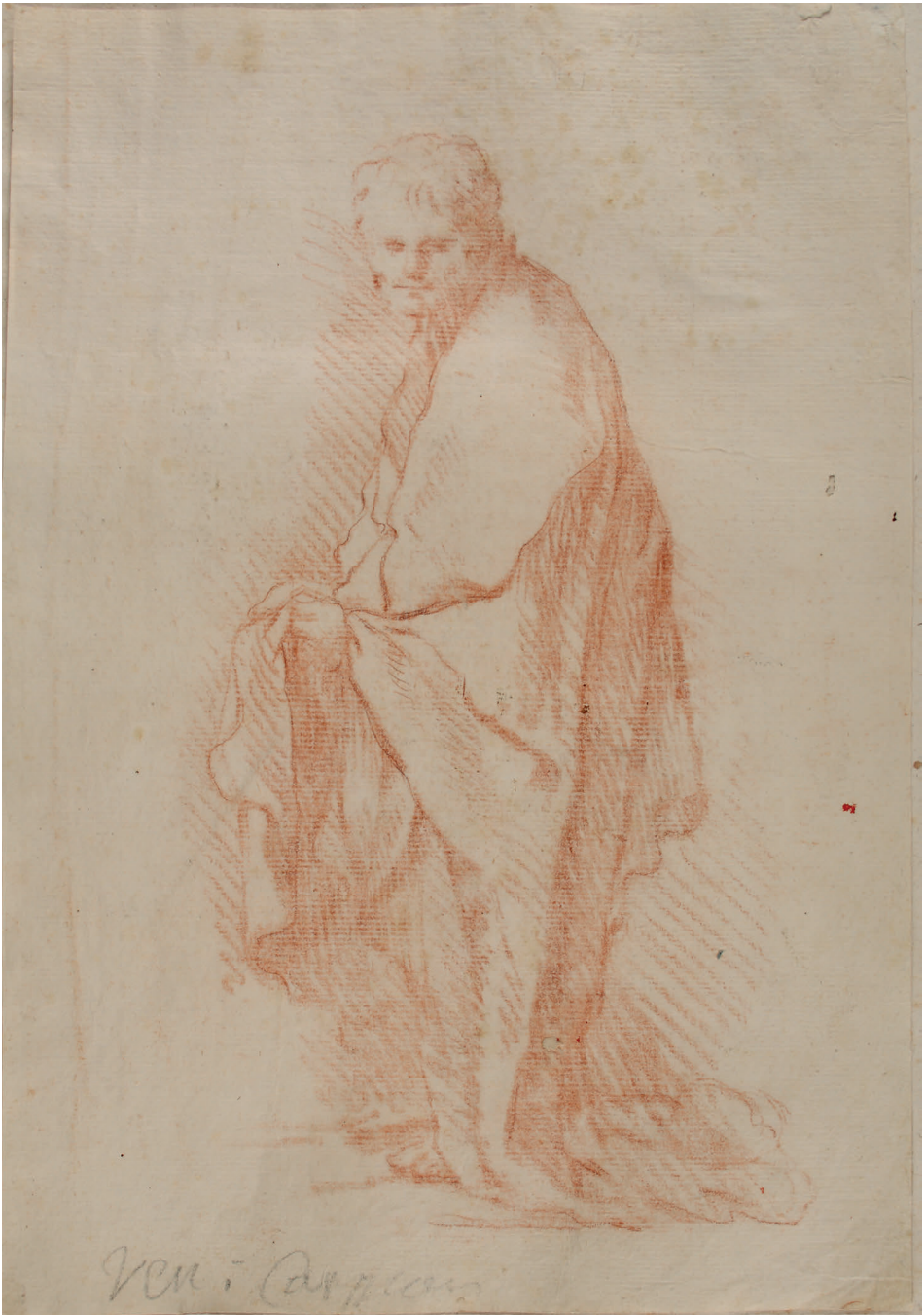
Abbildung 11: Joachim von Sandrart – Abklatsch: Unbekannter Heiliger (Kat. 92)