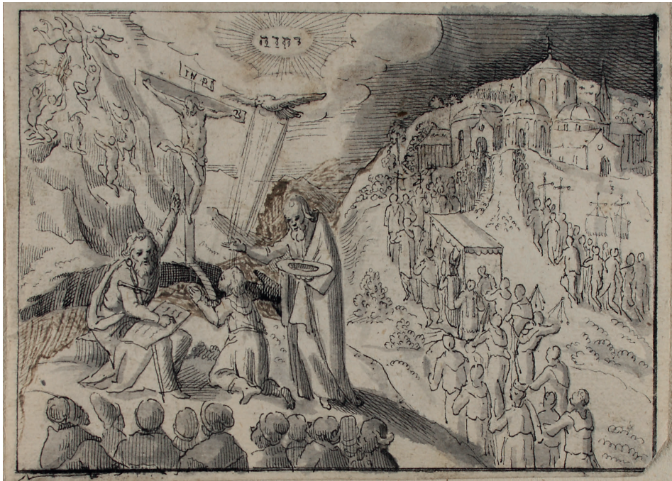
Abbildung 10. Süddeutsch: Der evangelische und der päpstliche Gottesdienst (Kat. 52)

Die Szenerie ist durch allseitige Beschneidung stark verstümmelt und muss ehemals deutlich größer gewesen sein. Im Zentrum des Blatts ist aber eindeutig die am Pult kniende Figur der Maria – vom Hals abwärts an – zu erkennen. Die Gewandfalten sind merkwürdig kleinteilig ausgebuchtet. Der Georgskampf verso stammt von demselben Zeichner.