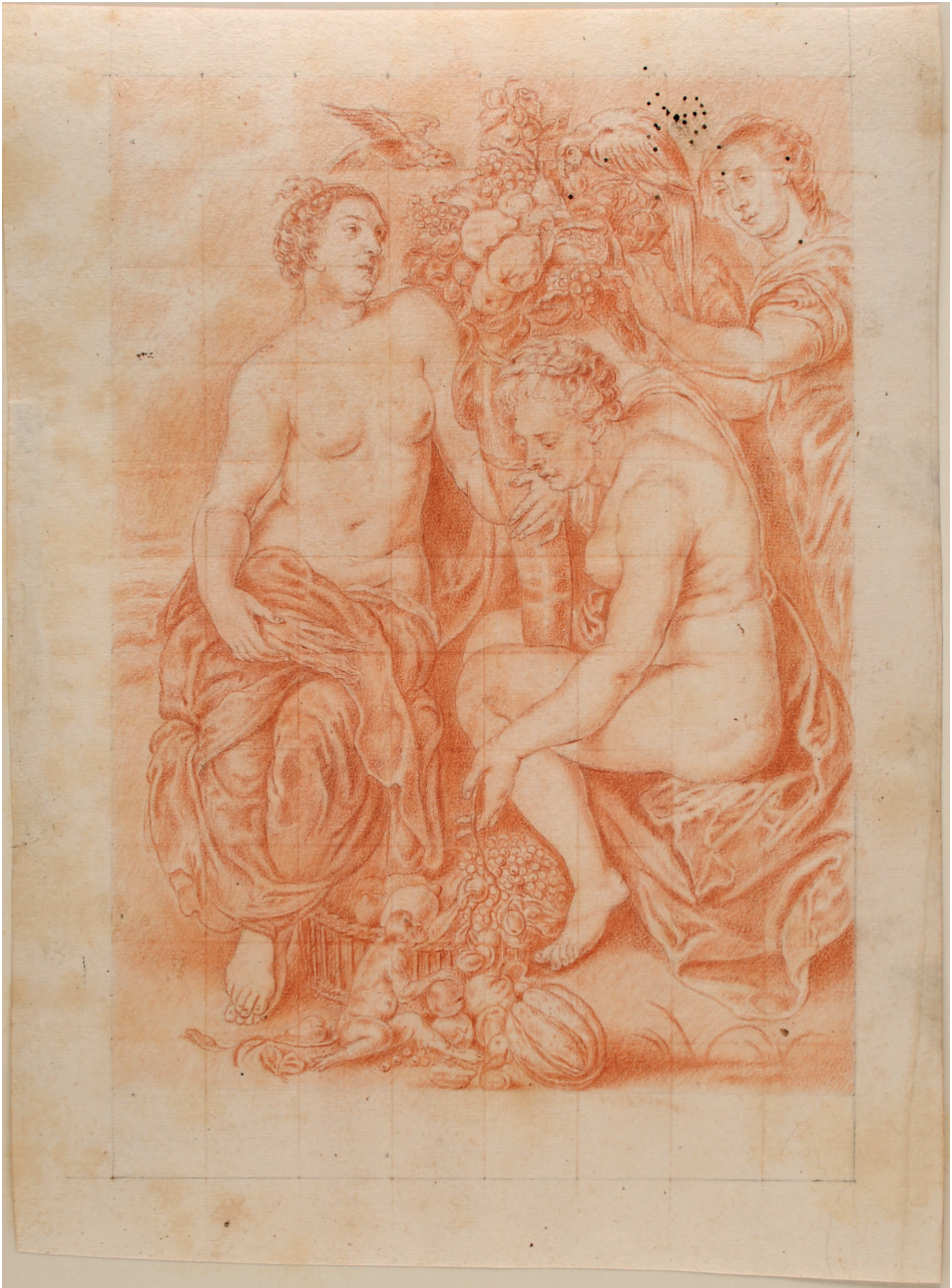
Abbildung 19. Peter Paul Rubens – Kopie: Drei Nymphen mit Füllhorn (Kat. 165)