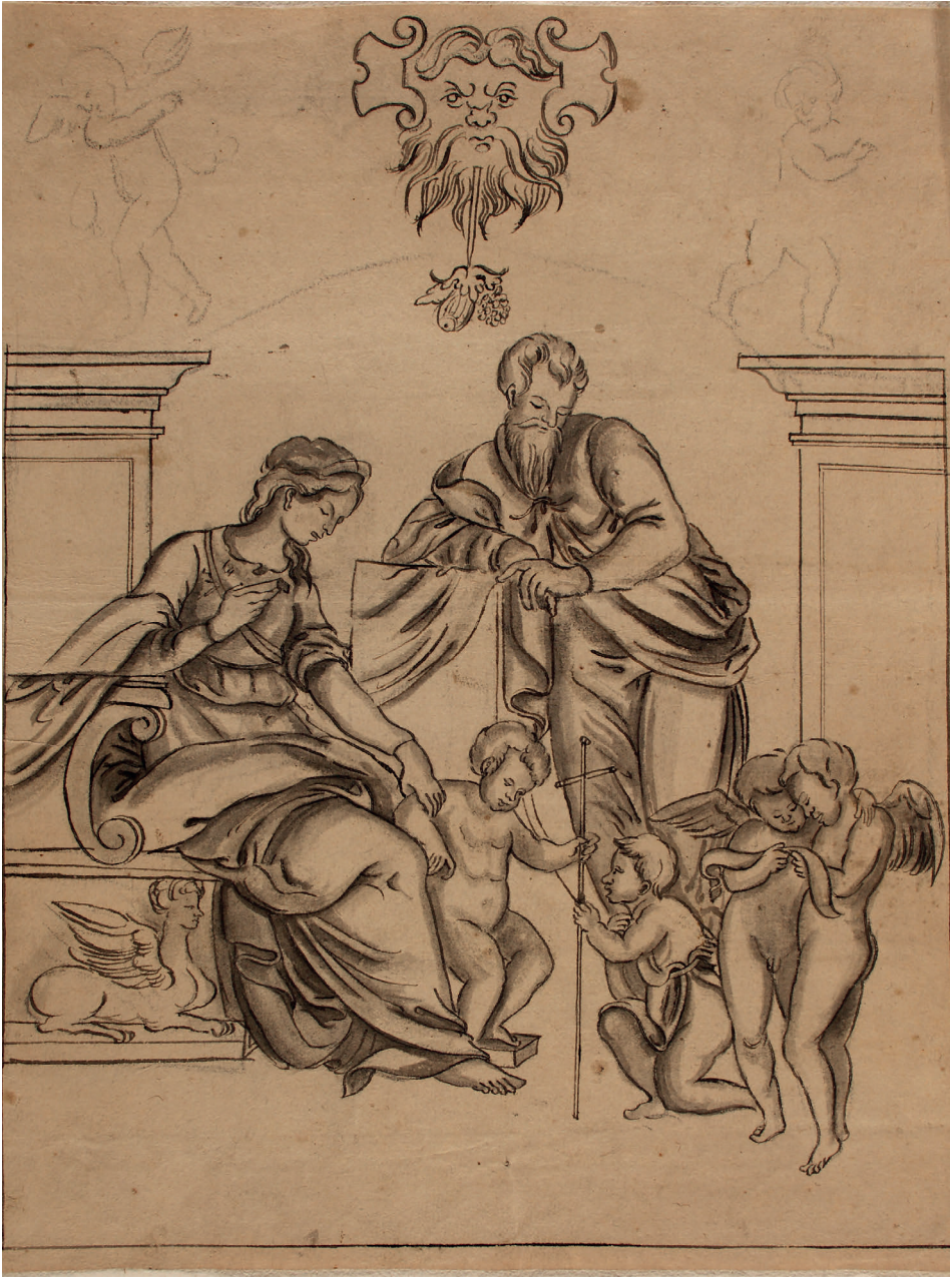
Abbildung 17. Giulio Romano – Kopie: Die Heilige Familie mit Johannes dem Täufer und zwei Engeln (Kat. 143)