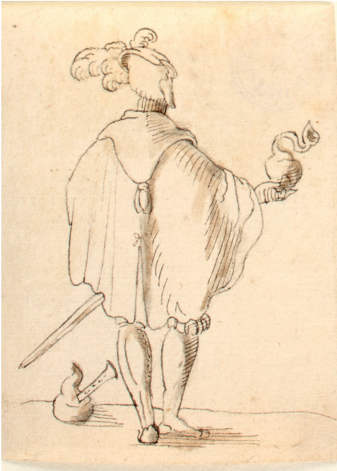
Abbildung 5. Peter Flötner: Männliche Rückenfigur (Kat. 9)