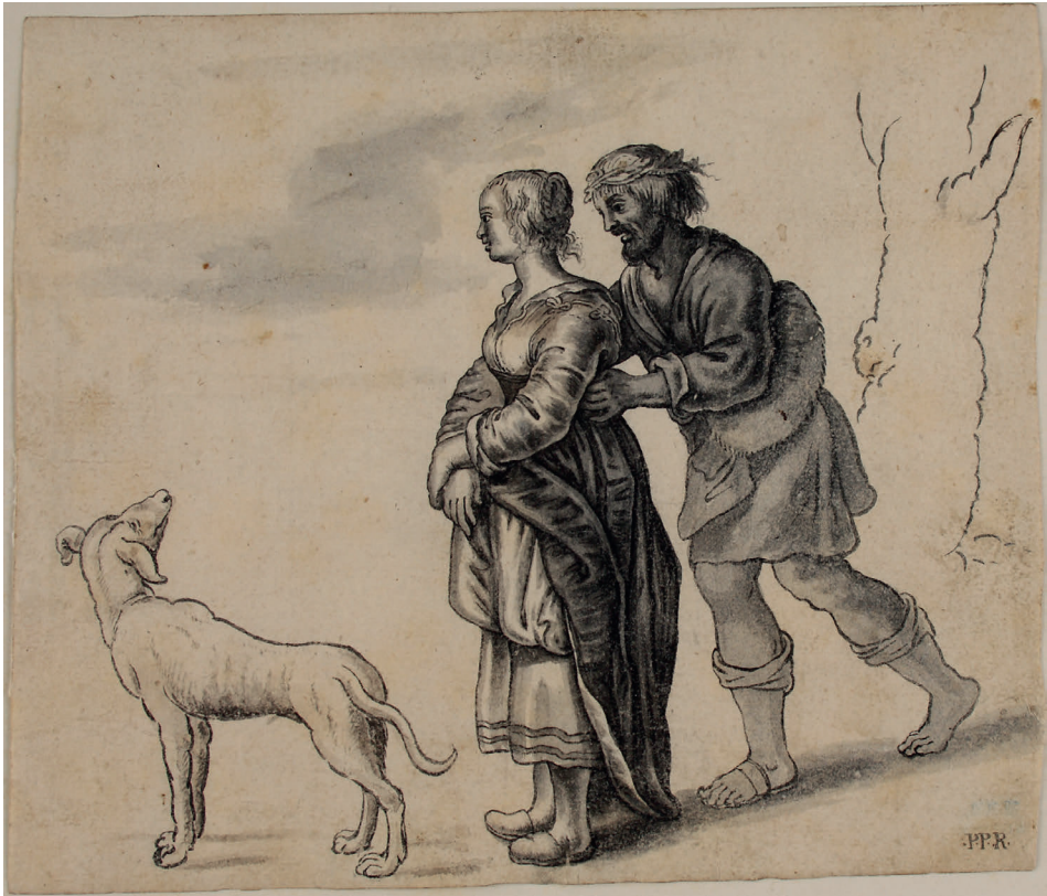
Abbildung 18. Schelte a Bolswert – Kopie: Junges Paar mit Hund (Kat. 151)