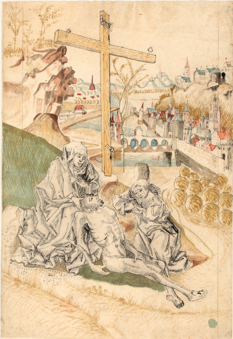
Abbildung 1. Nürnberg (?): Beweinung Christi (Kat. 1)