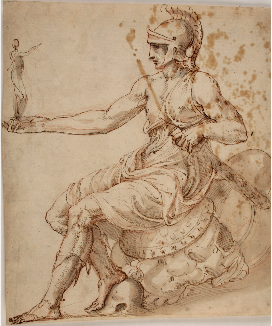
Abbildung 16. Giovanni Battista Palumba – Kopie: Personifikation der Roma (Kat. 141)