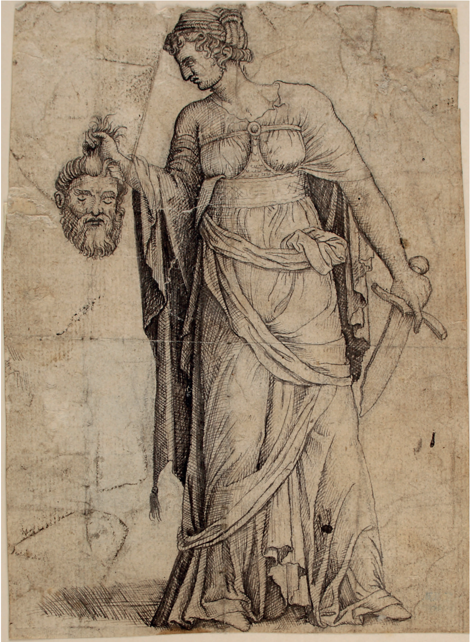
Abbildung 13: Andrea Mantegna – Kopie?: Judith mit dem Kopf des Holofernes (Kat. 124)