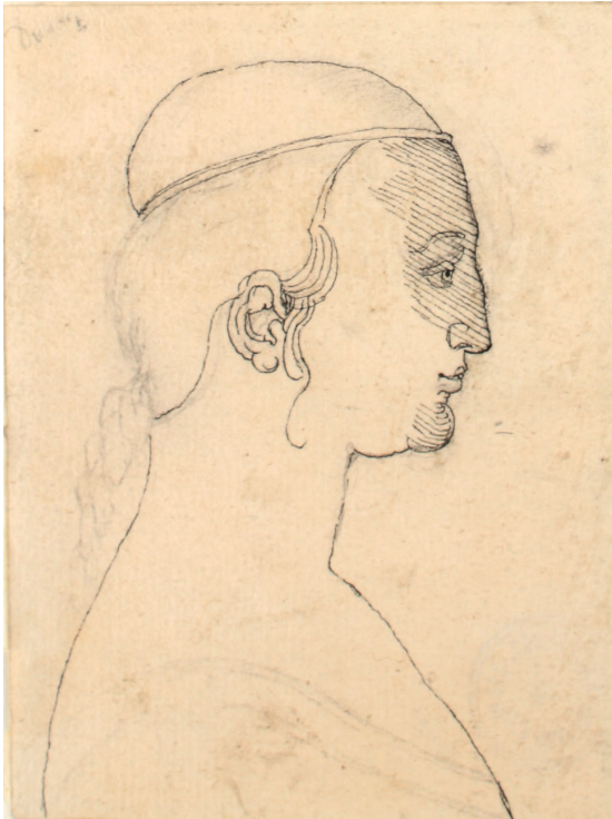
Abbildung 3. Nach Albrecht Dürer: Weiblicher Profilkopf, nach rechts (Kat. 7)