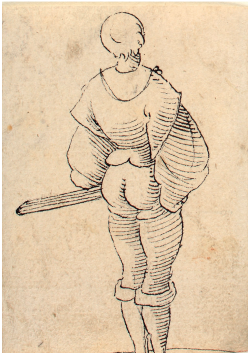
Abbildung 6. Peter Flötner: Männliche Rückenfigur (Kat. 10)