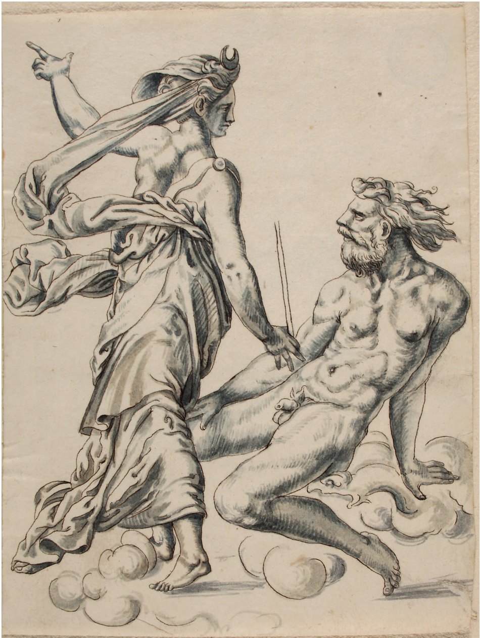
Abbildung 14. Gian Giacomo Caraglio – Kopie: Jupiter und Io (Kat. 128)