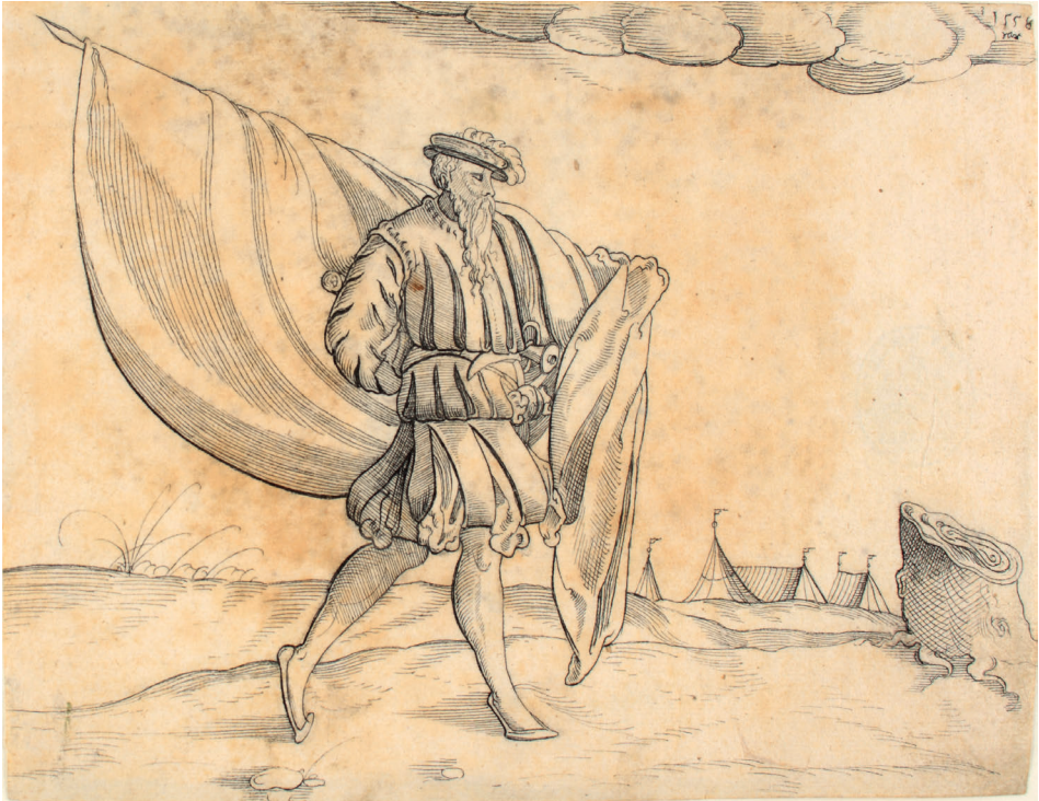
Abbildung 8. Monogrammist MS (?): Fahnenträger nach rechts (Kat. 16)