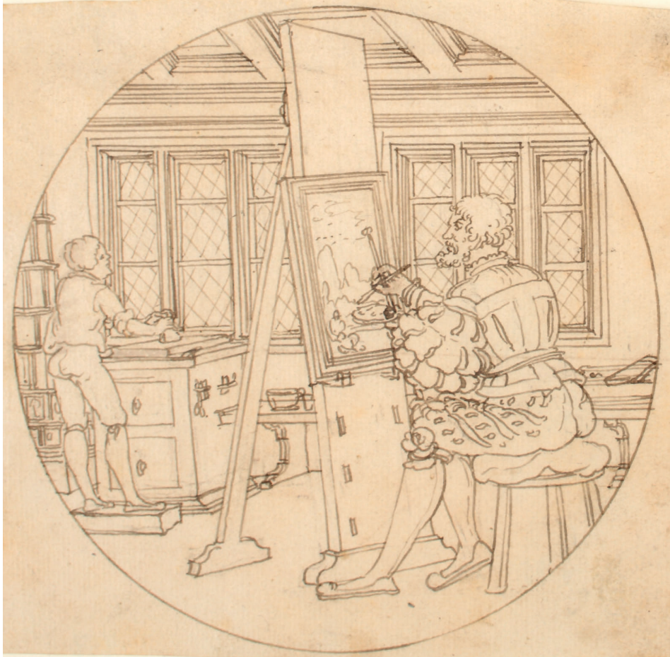
Abbildung 2. Augsburg (?): Atelierszene (Kat. 5)

Das angeblich 1481 entstandene Bildnis nimmt sich im Kontext der süd-deutschen Zeichnungen des 16. Jahrhunderts, unter die es dem Motiv nach einzuordnen wäre, wie ein „Fremdkörper“ aus. Wahrscheinlich hatte Bock berechnete Zweifel, was die Authentizität des Blattes betraf, und sortierte es aus diesem Grund 1929 aus. Es ist auch nicht von der Hand zu weisen, dass die Zeichnung zu einem späteren Zeitpunkt in betrügerischer Absicht entstanden ist.