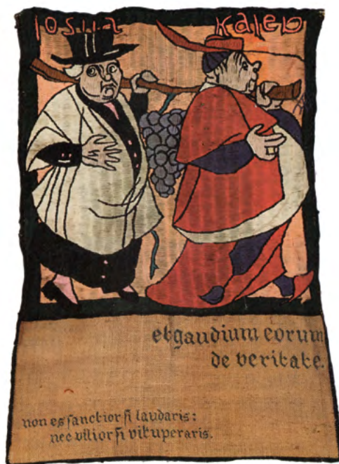
'Die lap' (uit: De hemeldeer op een kier , p. 35).