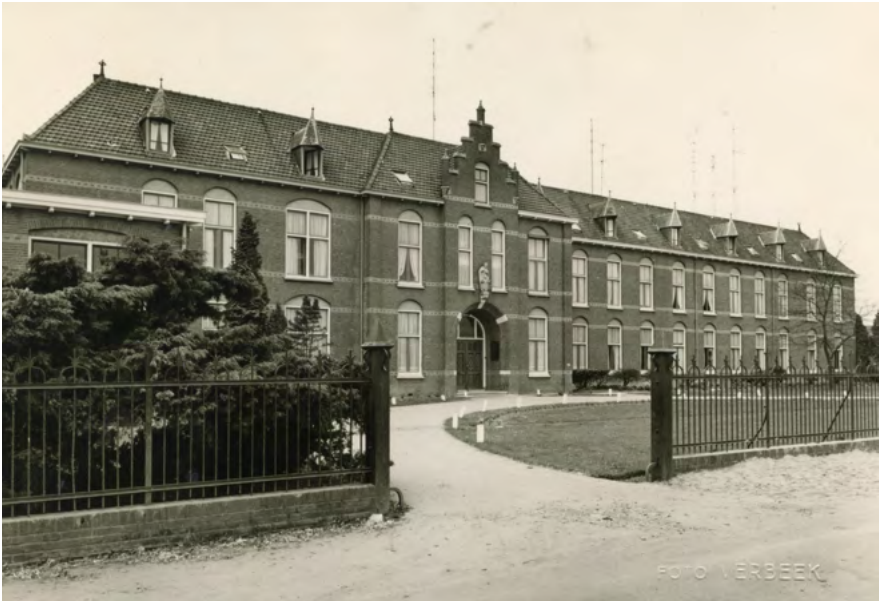
Klooster van de Zusters van Steyl, vanaf 1955 van de Franciscanessen van Waltbreitbach, in Lent (ansichtkaart).

demie de kernzin uit het boek: ‘De geschiedenis der christelijke monumenten wordt aldus minder een kunstgeschiedenis voor morphologen dan wel een geschiedenis van inhouden, van thema’s, van heilige voorstellingen: een geschiedenis der christelijke gedachte.’