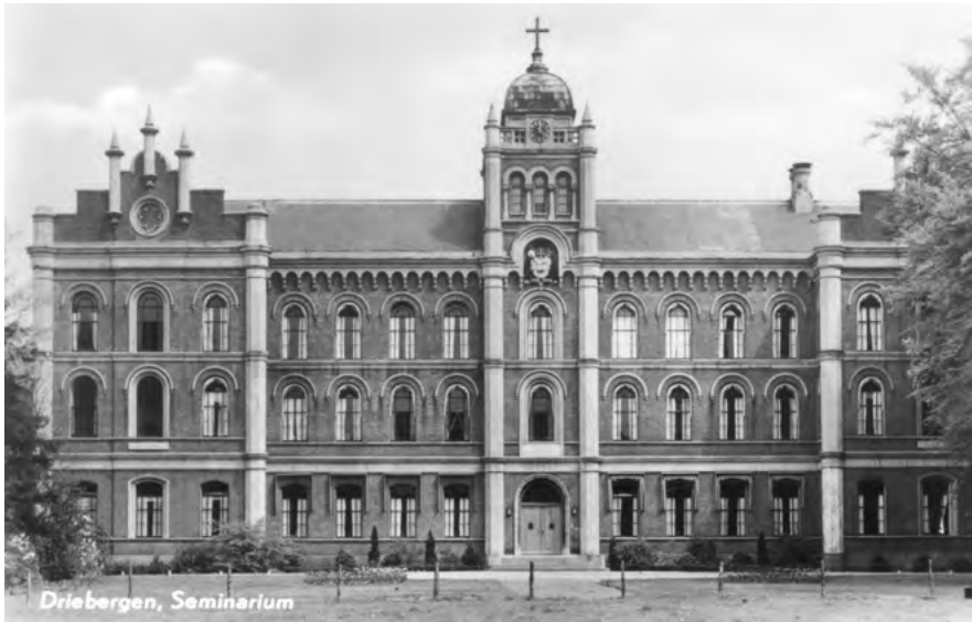
Grootseminarie Rijsenburg (ansichtkaart, collectie KDC 1a17314).