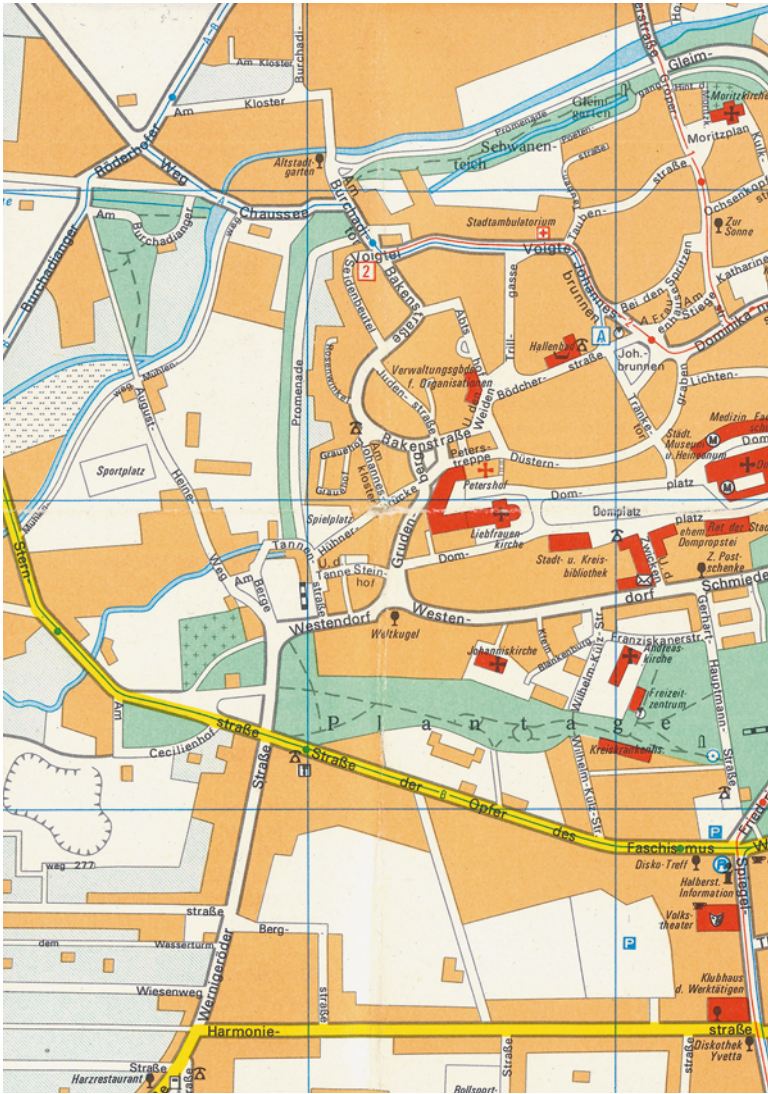
Karte: Stadtplan von Halberstadt, VEB Tourist Verlag, 1983 (Ausschnitt).