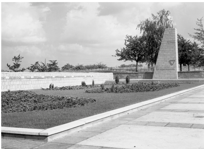
Abb. 2: Der Gedenk- und Appellplatz der Gedenkstätte Langenstein-Zwieberge nach seiner Umgestaltung 1968.

Im Oktober 1987 besuchten Jitzchak und Rafael Auerbach, die Söhne des letzten Rabbiners der Jüdischen Gemeinde, Hirsch Benjamin Auerbach, Halberstadt. Auf ihrem Rundgang durch die Altstadt nahmen sie auch den ehemaligen Standort der Synagoge in Augenschein, der ihr Vater von 1933 bis 1938 vorgestanden hatte. Die Gemeinde hatte sie 1939 im Gefolge des Novemberpogroms bis auf das Fundament abtragen müssen. Bald fünfzig Jahre nach diesem Gewaltakt präsentierte sich das im Hinterhof von Baken- und Judenstraße gelegene Areal in gleichermaßen verwun-