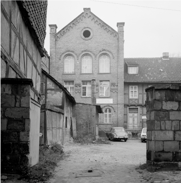
Abb. 3: Die ehemalige Klaussynagoge im Rosenwinkel 18 zur Zeit ihrer Nutzung durch den VEB Pinselfertigung Halberstadt, nach 1979.