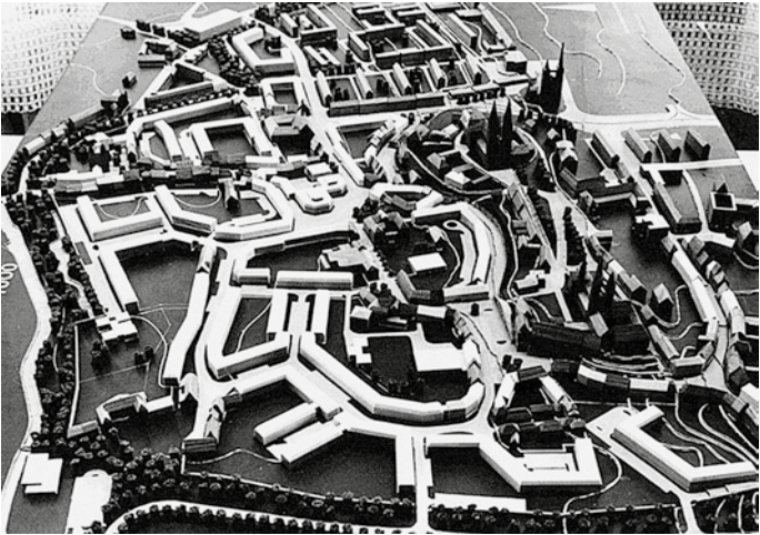
Abb. 4: Modell des avisierten Umbaus der Halberstädter Altstadt (1984); der ehemalige Rosenwinkel ist durch komplexen Wohnungsbau überbaut (Bildmitte unten).