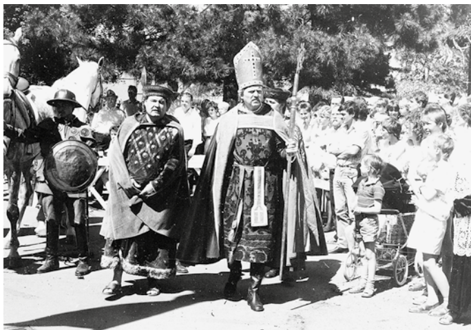
Abb. 5: Stadtfest zum tausendjährigen Jubiläum der Verleihung der Markt-, Münz- und Zollrechte; Marktbild zum »Bischofszug«, 17. Juni 1989.

Im Juni 1989 beging Halberstadt das tausendjährige Jubiläum der Verleihung der Markt-, Münz- und Zollrechte im Jahr 989. Höhepunkt der aufwendig gestalteten Festwoche war, neben verschiedenen Kulturveranstaltungen, der Auszeichnung verdienter Bürger und einem breiten gastronomischen Angebot mit Volksfestcharakter, die Nachstellung von sechs historischen Episoden in sogenannten Marktbildern, die ausgewählte Facetten der Stadtgeschichte repräsentierten. Gegenstand der mit in der gesamten DDR gecasteten Schaustellern und Laienschauspielern besetzten sowie mit Pferden inszenierten Historienbilder waren die Verleihung der Marktrechte durch Otto III. 989, der »Halber-