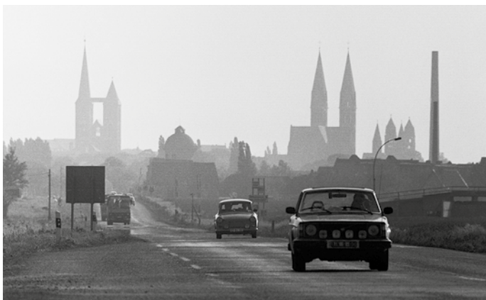
Abb. 1: Die Silhouette Halberstadts aus nordöstlicher Richtung, Juli 1989.

Wer Anfang des 20. Jahrhunderts das malerisch im nördlichen Harzvorland gelegene Halberstadt besuchte, dürfte zu diesem Zweck in nicht wenigen Fällen den erstmals 1905 verlegten Reiseführer Halberstadt in Wort und Bild zur Hand genommen haben. Das Büchlein begleitete den Besucher auf einem imaginierten Stadtrundgang, der am damals noch vor den Toren der Stadt gelegenen Bahnhof begann und sodann zu den Sehenswürdigkeiten Halberstadts führte. Dazu zählten in erster Linie beeindruckende Sakralbauten wie der gotische Dom, die romanische Liebfrauenkirche und die das markante Stadtbild komplettierende Martini-kirche. Mehr noch war Halberstadt aber berühmt für seine einige Hundert Gebäude zählende historische Fachwerk-