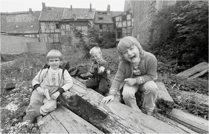
Abb. 6: Kinder spielen im Hinterhof von Baken- und Judensstraße, dem vormaligen Standort der Synagoge, 1987.

Im Jahr 1992 führten zwei Halberstädter Geschichtsstudentinnen unter Schülern ihrer Stadt eine Umfrage durch, mit deren Hilfe sie deren Kenntnisse zur jüdischen Geschichte erheben wollten. Damit waren die beiden Teil einer ganzen Reihe von Initiativen, die erkannt hatten, dass die jüdische Vergangenheit Halberstadts während vierzig Jahren DDR sträflich vernachlässigt worden war, und denen es ein Bedürfnis war, die neu gewonnene Freiheit von 1989/90 dazu zu nutzen, solcherart Fragen künftig uneingeschränkt nachzugehen. Das Ergebnis ihrer Befragung unter insgesamt 142 Schülern der Klassenstufen acht bis zwölf (14 bis 19 Jahre), bestehend aus sechs Fragen, war allerdings frappierend. 49 Prozent vermochten es nicht, überhaupt eine