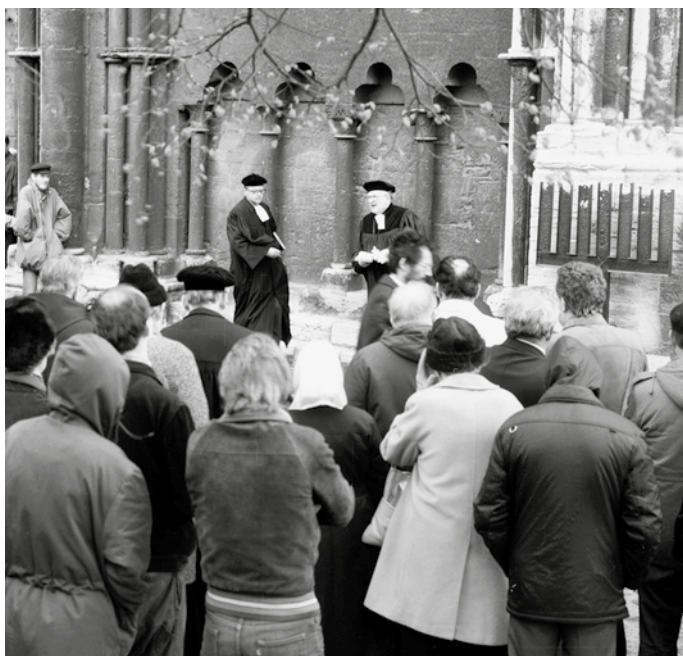
Abb. 7: Einweihung des Mahnmals vor dem Dom, 8. April 1982. In der Bildmitte Landesbischof Werner Krusche bei seiner Ansprache.

Am 8. April 1982 kam es auf dem Halberstädter Domplatz zu einer außergewöhnlichen Veranstaltung. Vor dem Westportal des Doms, dort, wo sich vier Jahrzehnte zuvor alle noch verbliebenen Halberstädter Juden unter sechzig Jahren zu ihrer Deportation hatten einfinden müssen, wurde an diesem Tag – Gründonnerstag – ein Mahnmal eingeweiht, das der jüdischen Bürger der Stadt und ihrer