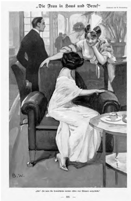
Abb. 6: Brynolf Wennerberg: Die Frau in Haus und Beruf .

geknüpft, sondern wurde auch im Kontext der Eliten gedacht. Legitimer Teil des modernen Bildes der Frau konnte ganz offensichtlich die Praxis der Kunstmatronage sein, die auch durch die Ausstellung 1912 in ein emanzipatorisches Tätigkeitsfeld umgedeutet wurde. 47