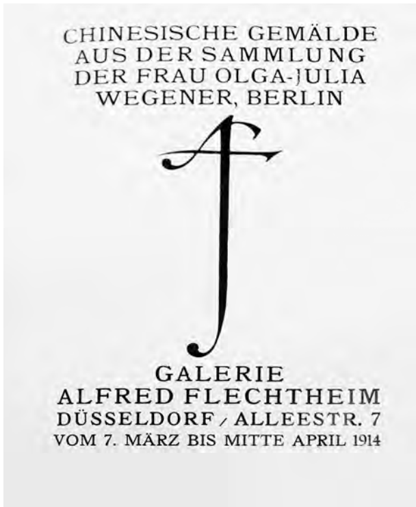
Abb. 14: Katalog der Ausstellung »Chinesische Gemälde aus der Sammlung der Frau Olga-Julia Wegener«.

Auf die Pariser Ausstellung folgte 1913 die Präsentation der Sammlung im Budapester Kunstgewerbemuseum. 572 Bereits 1914 wurde sie erneut ausgestellt, dieses Mal im zweiten Stock der neu gegründeten Düsseldorfer Galerie Alfred Flechtheims, die in der Regel Werke moderner europäischer Künstler präsentierte. 573 Ähnlich wie die Pariser reagierte auch die Düsseldorfer Kritik positiv auf die Ausstellung: