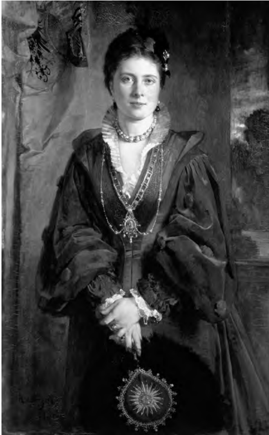
Abb. 9: H. v. Angeli, Kronprinzessin Victoria im Renaissancekostüm .