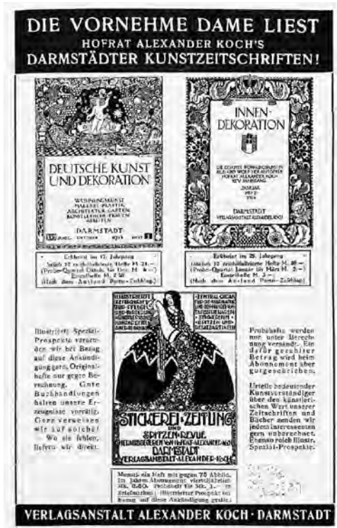
Abb. 1: Werbeanzeige der Verlagsanstalt Alexander Koch.

lungen waren im Kaiserreich noch wenig besucherfreundlich gestaltet und der Museumsbesuch häufig eine ungern erfüllte gesellschaftliche Pflicht der Elite. 20 Dass es nicht selten Frauen mit großer Bildungsbefähigung waren, die einen wichtigen Teil des Ausstellungspublikums bildeten, hielt der jüdische Künstler Moritz Daniel Oppenheim in dem Gemälde Der Museumsbesucher / Besuch im Skulpturenmuseum (1865) – wohl auch in Anspielung auf ein besonders ausgeprägtes Bildungsstreben von Jüdinnen – fest. Noch wesentlich beliebter und kunstpolitisch von höherer Brisanz waren die temporären Berliner Kunstausstellungen, die im späten 19. Jahrhundert immer stärker den Charakter »darwinistischer