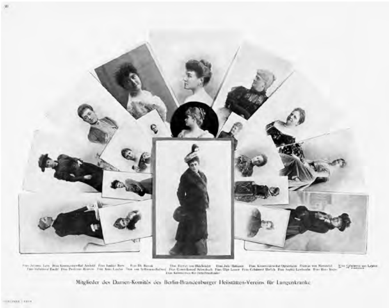
Abb. 5: »Mitglieder des Damen-Komitees des Berlin-Brandenburgischer Heilstätten-Vereins für Lungenkranke«.