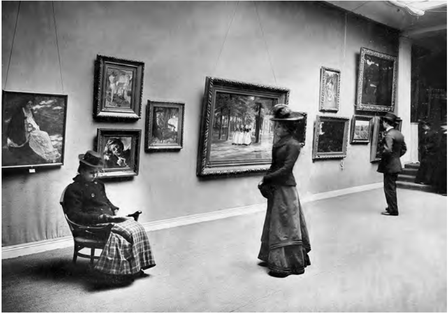
Abb. 10: Besucherinnen bei der Ausstellung deutscher Naturalisten, 1899, Kunstsalon Cassirer.